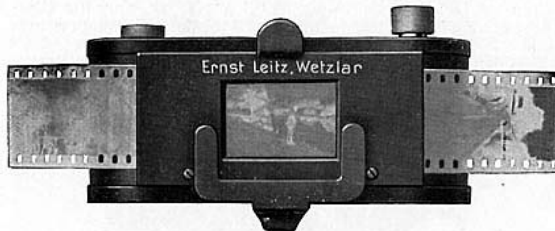
Fig. 4 (1/2 natürl. Größe)

Fensterplatte ermöglicht auch Kopien von Kino-Negativen im Format 18 \times 24 mm. Der Negativfilm läßt sich unabhängig von dem Positivfilm einsetzen und bewegen, sodaß man die Bilder in beliebiger Wahl und Reihenfolge kopieren kann. Die Spulen im Apparat fassen einen Filmstreifen von reichlich 3 m Länge.