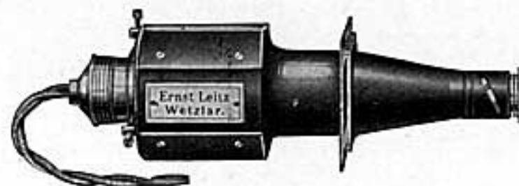
Fig. 3 (ca 1/4 natürl. Größe)

Die Lampe ist eine kleine Osram-Hauskino-Lampe von 6 Volt, 50 Kerzen (über 4,3 Amp. abzusichern). Sie sitzt in